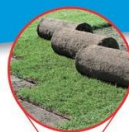
Van de Wetering Paradijs 75 • Elsendorp GRASZODEN EN FOURAGE