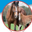
Stal Krol Haveltweg 66 • Handel PAARDENHOUDERIJ