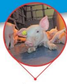
Melis V.O.F. Paradijs 10 • Elsendorp VARKENSHOUDERIJ